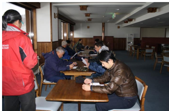
索道従業員に安全なリフト運行に必要なことを説明する安全統括管理者(社長)及び索道技術管理者