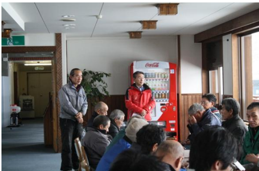
索道従業員に安全なリフト運行に必要なことを説明する安全統括管理者(社長)